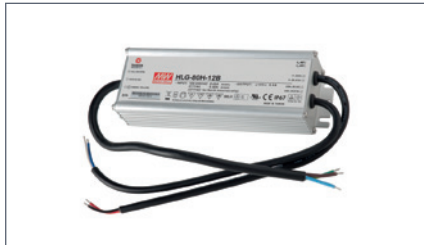
4207128 HIMMENNETTÄVÄ LIITÄNTÄLAITE IP65