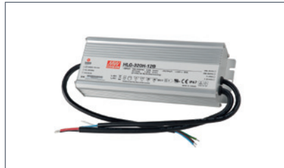
4207130 HIMMENNETTÄVÄ LIITÄNTÄLAITE IP65