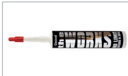
A2TRIX A207330 ASENNUSLIIMA

Profilin pituus on 1670 mm eli kolmella profililla voidaan asentaa 5 m nauha. Varmistaa suoran asennuksen ja nauhan pysyvyyden asennuspinnassa.