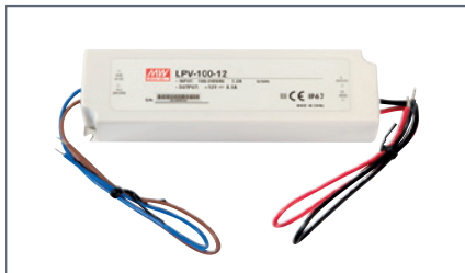
4207121 LIITÄNTÄLAITE IP67