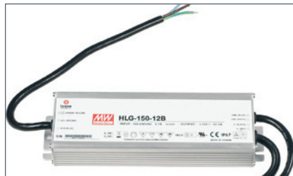
4207122 HIMMENNETTÄVÄ LIITÄNTÄLAITE IP65